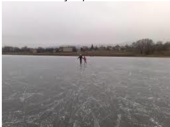
Ružín v zime

Obec Košická Belá leží v nadmorskej výške 380 metrov v severovýchodnej časti Volovských vrchov v tzv. Hámorskej brázde v doline potoka Belá, ktorý ako pravostranný prítok Hornádu zásobuje Ružínsku priehradu. Chatisko (200 m od Penziónu Sivec) je situované v lone krásnej prírody v rekreačnej oblasti Ružínska priehrada medzi lyžiarskymi strediskami Jahodná a Plejsy cca 25 km od Košíc. V prípade priaznivých poveternostných podmienok (mínusové teploty) je možné korčuľovanie na Ružínskej priehrade. Chata prešla rekonštrukciou v rokoch 2013 – 2014 a je v prevádzke od 11/2014. Chatisko je zaradené do kategórie hotel Garni / B&B. Do jaskyne sa dostaneme presunom autami a pešo cca 1,5 - 2 hod.. Doporučujeme vziať si oblečenie, ktoré sa môže značne zašpiniť. Nezabudnite na baterky – na svietenie v jaskyni.